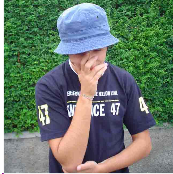
Ste Mita disperato dopo la contestazione dei tifosi

La squadra di Voeller non dovrà più permettersi di lasciare altri punti alle spalle se non vuole che le condizioni degenerino, già a partire dalla delicatissima trasferta con l'Olimpic Pep di domenica prossima.