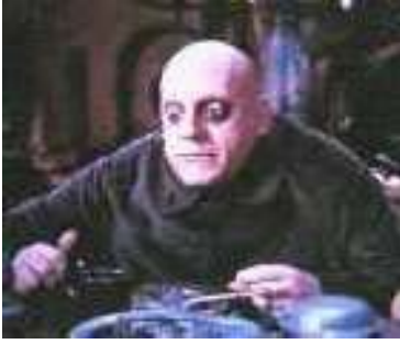
Ecco a voi Gallianacci, il nostro presidente di Lega

Il presidente di Lega non accoglie le richieste del Rebo di anticipare l'asta