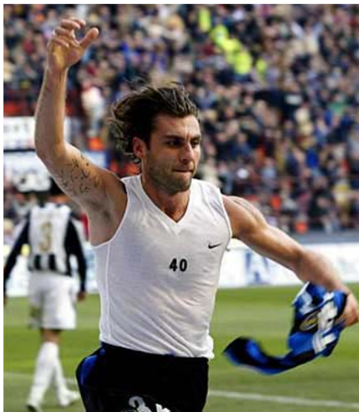
L'esultanza di Bobo dopo il gol vittoria contro i Simpson