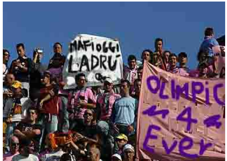
Uno scorcio della curva ospite

Prime battute di gioco molto confuse, con Nakata che non riesce a dettare i tempi e Doni che gioca decisamente sottotono.