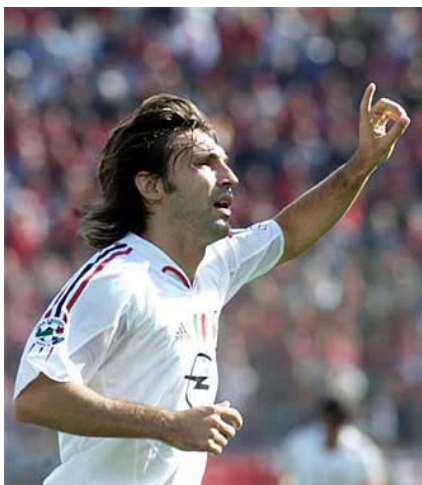
Pirlo esulta dopo il gol dell'1-0